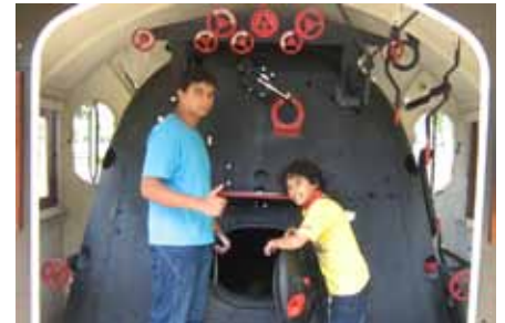
Na Atividade Cultural Externa, visitaram o Museu Catavento, com invenções que melhoraram a vida dos cidadãos.

Além de trabalhar com esse tema, nossos jovens também retomaram os assuntos vistos na escola de origem. Os que participaram do acompanhamento individual mostraram que estão se conscientizando da importância dessa proposta, pois trouxeram o próprio material didático para dar continuidade aos conteúdos abordados em sua escola, potencializando assim o seu aprendizado.