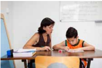
Adolescentes realizam pesquisas e leituras sobre direitos e deveres sociais.