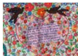
Um dos bordados apresentados na exposição do SESC Pinheiros.

Na ACTC, nossas bordadeiras vivem um tempo de espera, muitas vezes insistentemente lento, mas, enquanto aguardam a recuperação dos filhos, alinhavam esperanças, dando vida aos tecidos com sua força criativa.