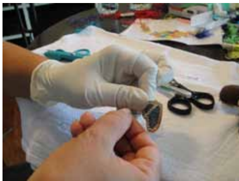
Mãe/acompanhante da ACTC produzindo peça do projeto Bordando Design.