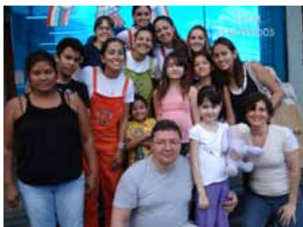
Mães/acompanhantes, crianças, adolescentes e educadores da ACTC foram recebidos pelos monitores da Cidade do Livro.

Atividade Cultural Externa teve objetivo de promover a leitura. Texto produzido pela Educadora Regiane Iglesias.