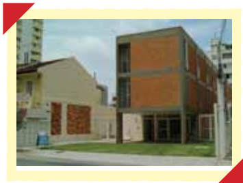
Fachada da sede da ACTC.

Nos meses de janeiro, fevereiro e março, recebemos muitas visitas, que vieram conhecer de perto as atividades e os trabalhos desenvolvidos pela ACTC. Agradecemos o interesse e aguardamos o retorno de todos.