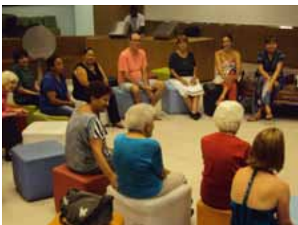
Encontro de bordadeiras ofereceu oportunidade para a troca de experiências.

A diversidade e a criatividade presentes na exposição mostraram que a linguagem do bordado no Brasil tem recebido múltiplas adaptações e suas técnicas têm sido repassadas e reinterpretadas. Assim, mantendo a tradição ou reinventando pontos, colocando sentimentos e emoções, as bordadeiras dos diferentes grupos mostraram, em seus encantadores trabalhos, que a criação de imagens, por meio de linha e agulha, vêm carregadas de memórias familiares, de histórias de vida, de costumes, de lugares e também de literatura.